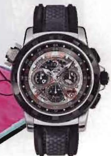
Patravi TravelTec FourX von Carl F. Bucherer, ca. 32500 Euro