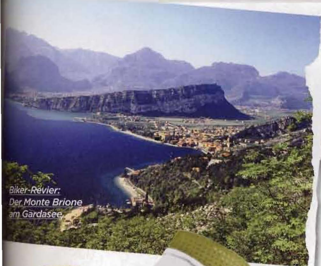
Biker-Révier: Der Monte Brione am Gardasee