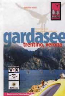
Reiseführer von Reise Know-How, 17,50 Euro