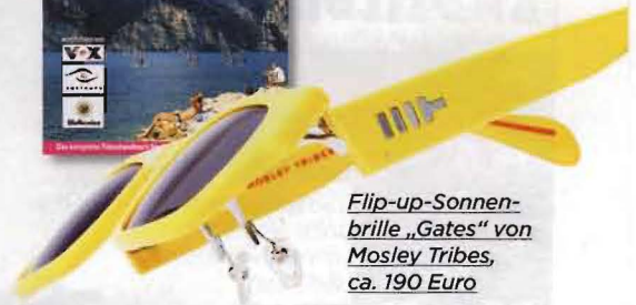
Flip-up-Sonnenbrille „Gates“ von Mosley Tribes, ca. 190 Euro