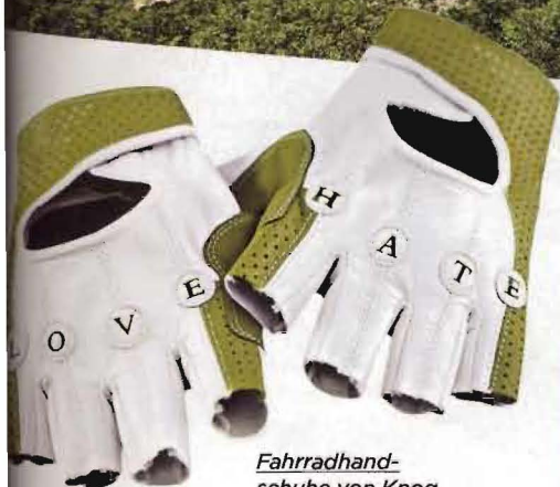
Fahradhandschuhe von Knog, 37,5