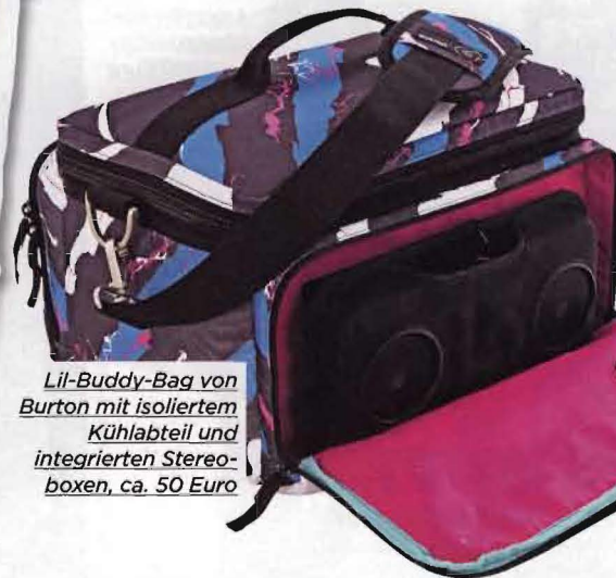
Lil-Buddy-Bag von Burton mit isoliertem Kühlteil und integrierten Stereo- boxen, ca. 50 Euro